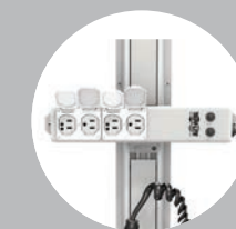
Steckdosenleisten in Krankenhausqualität