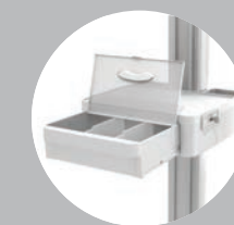
Modulare Ablagen Stor-Lock