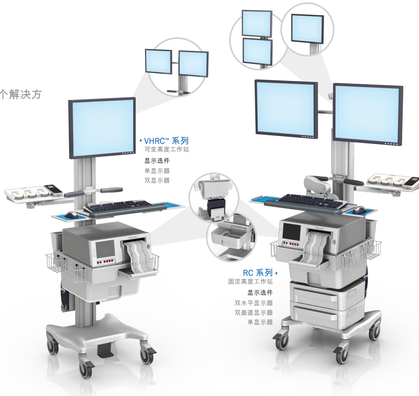
VHRC™ 系列 可变高度工作站 显示选件 单显示器 双显示器

当需要变更技术和应用时，模块化的耐用设计使您可以快速调整工作站，无需更换整个滑轮车。可变高度型号提供了额外的人体工学可调节性，适合坐/立应用，满足各种用户的需求。