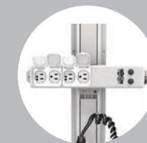
Blocs multiprise de type hospitalier