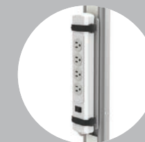
Support de bloc multiprise