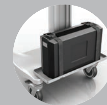
Supports pour onduleur