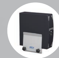
Supports pour unité centrale