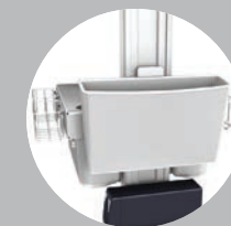
Casier à dossier